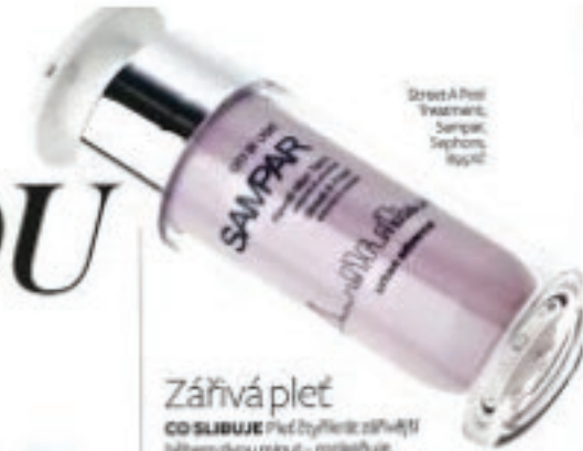
Strait A Peel Treatment, Sampar, Sephora, 100 Kč

NÁS VYHODNOTÍ Vypadá to, že má docela výdrž. Začala jsem nepatrně olupat až 6. den, kolem okrajů nehtů. Nicméně díky šlechetce se další tyto netoxické rychle opravily, aniž bych musela odlakovat celý nehet. Ale i tak je to skvělá, touha doba u mě ve většině nehty malované úplně jiným lakem.