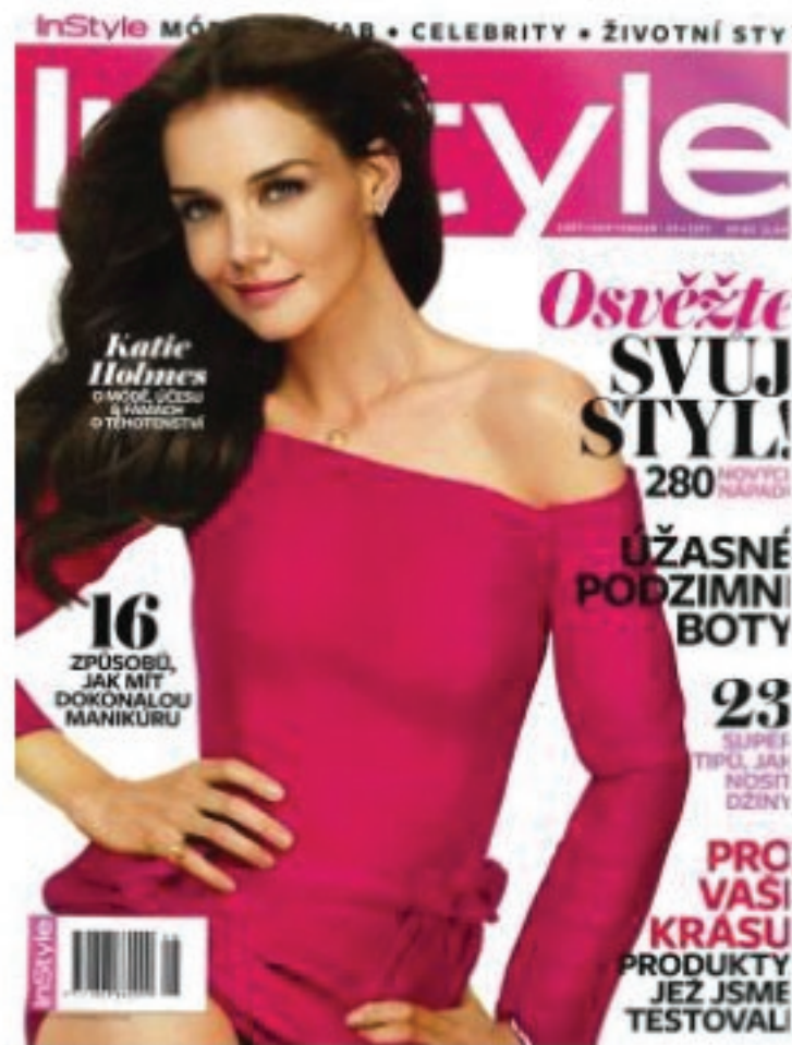
In Style September 2011